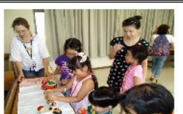
いろんなマトリョーシカがあるんだね。