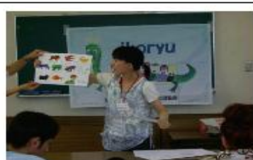
いろんな動物の名まえを覚えよう！