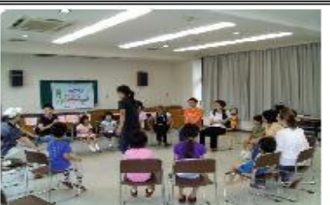
さあ、覚えただけのロシア語で「フルーツバスケット」をしましょう！