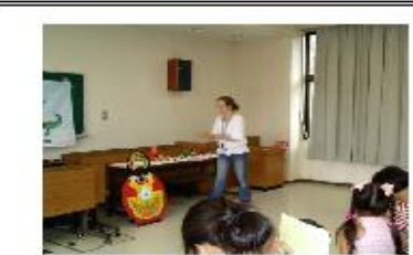
みなさん、「ロシア」という国を知っていますか？