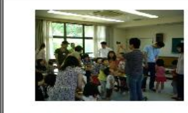
今日の工作は「びゅんびゅんコマ」牛乳パックを切り抜いたコマの真ん中に糸を通すのが難しい！