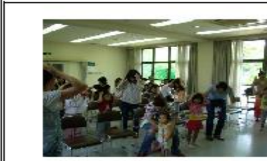
英語であそぼう！みんな大好き「頭、かた、ひざ」