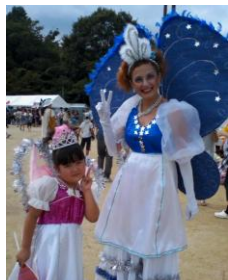
手作りのサンバ衣装がステキなお二人。ステージ発表後は、ikoryu テントでも大活躍。来年はみんなで出場しましょう！