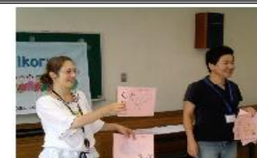
ロシア語で言えるかな？ 発音をよく聞いてね。