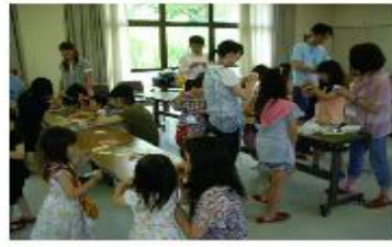
仕上げに色をぬって、世界にひとつだけの「my Koma」の出来上がり、