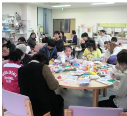
11時オープン、あっという間に満席

ご来場者数70数名。折り紙、紙芝居、ぜんざい、おしゃべり、楽しい時間はあっという間に過ぎました。折り紙名人のボランティアのみなさん、ありがとうございました。 次回は来春3月の予定です。お楽しみに♪♪♪