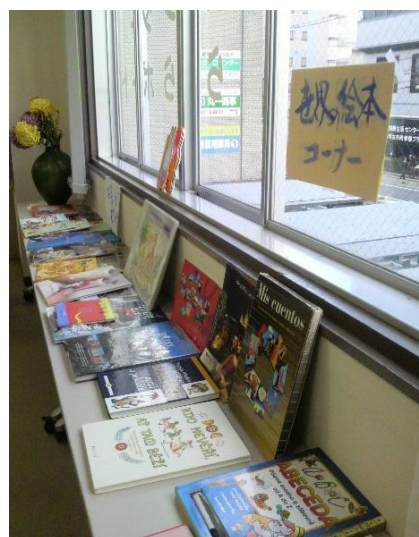
ハンガル・中国語・スペイン語・ポルトガル語・英語などいろんな国の絵本が大集合！ 同じお話を3ヶ国語で翻訳していたり、絵本の世界もバラエティ豊かです。