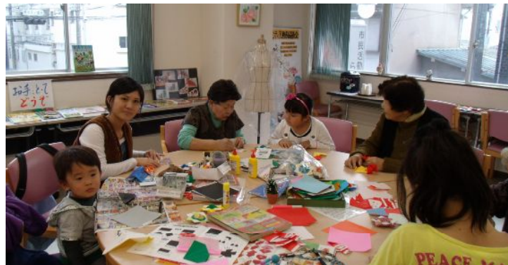
サンタ、箱、コマなど、ボランティアさんから教えていただきました。