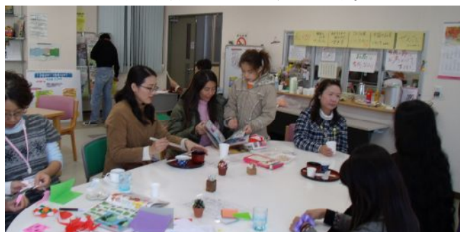
折り紙サンタ、ぜんざいに添えられたもみじ、「お正月は、どんな風に過ごす？」日本の四季の豊かさに会話も自然に弾みます！