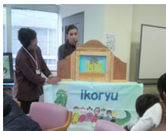
チェコのお話し「リンゴの木」