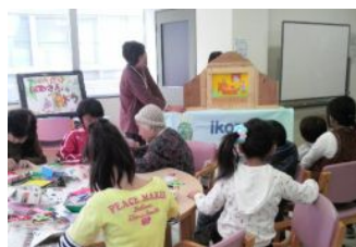
ロシアのお話し「くまと女の子」